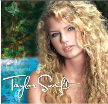
Taylor Swift (2006)