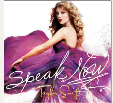
Speak Now (2010)